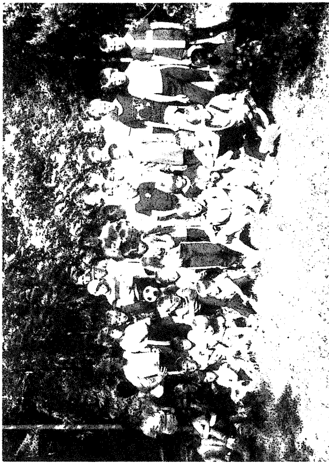
Juniorileirillä kesällä 1986