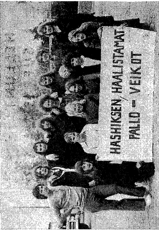
HARJAVALLAN HASHIKSEN HAALISTAMAT »HIPIT» HAALISTAVAT »KAUKALOPALLOSSA» VOITTAMATTOMINA PYSYNEET KAUPPALAN VIRKAMIEHET JALKAPALLO-OTTELUUN. PELIPAIKKANA KUPARIN KENTÄ JA AJANKOHTANA 3. 6. -71 KLO 19.00.

60-luvun hiljaisten vuosien jälkeen, vielä kun HaPo jalkapallo eli kuollutta aikaa, oli Harjavaltaan ilmes- tynyt tekemisen puutteeseen kyllästynyt nuorten "Hippien potkupallojoukkue".